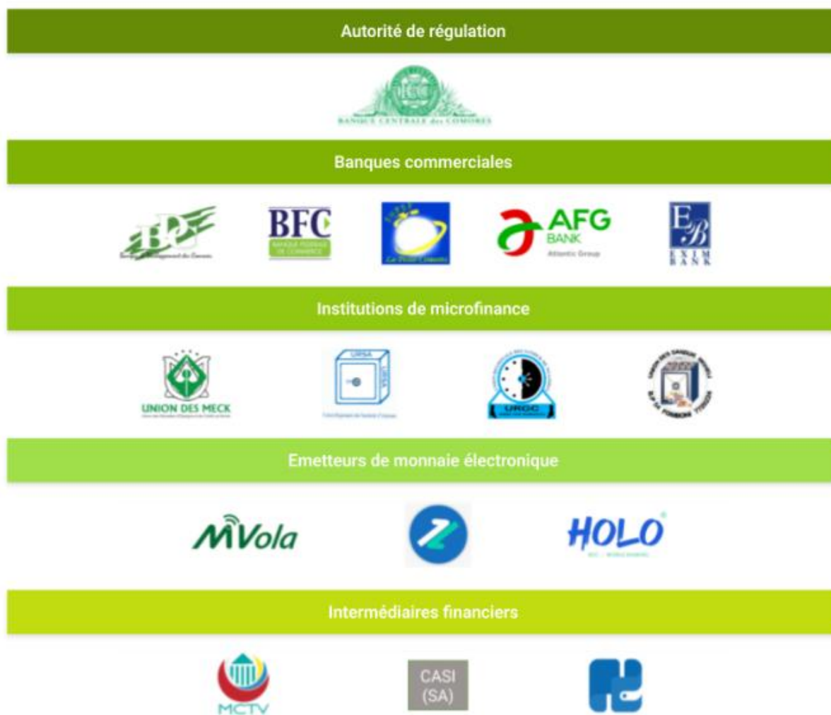
Figure 3 : Acteurs principaux du secteur financier comorien. 17

Les Comores disposent d'une variété d'acteurs du secteur financier, allant des banques commerciales aux institutions de microfinance, en passant par les émetteurs de monnaie électronique et incluant des intermédiaires financiers. Cet ensemble d'acteurs contribue à un système financier diversifié.