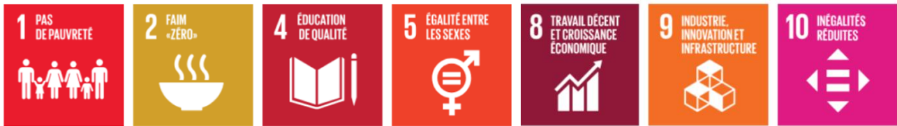
Figure 2 : Alignement SNIF & ODD.